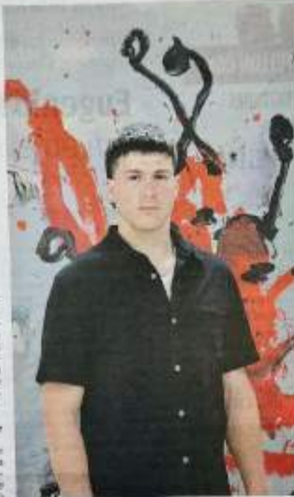
El artista se prepara para la presentación en la feria MARTE 2024.

La Bohemia acoge el estreno de un proyecto audiovisual sobre la pasión albinera