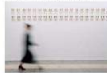
Vista interior de la feria MARTE.

Desde 1980 el Ayuntamiento de Castellón de la Plana ha impulsado el desarrollo del arte contemporáneo en la ciudad, fomentando la creación de una comunidad artística que ha permitido el desarrollo de un sector económico importante. Este compromiso se refleja en la creación de espacios como el Museo de Arte Contemporáneo de Castellón, el Palacio de Congresos y el Auditorio, que han permitido atraer a artistas de todo el mundo.