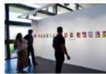
Vista interior de la feria MARTE.

Desde 1980 el Ayuntamiento de Castellón de la Plana ha impulsado el desarrollo del arte contemporáneo en la ciudad, fomentando la creación de una comunidad artística que ha permitido el desarrollo de un sector económico importante. Este compromiso se refleja en la creación de espacios como el Museo de Arte Contemporáneo de Castellón, el Palacio de Congresos y el Auditorio, que han permitido atraer a artistas de todo el mundo.