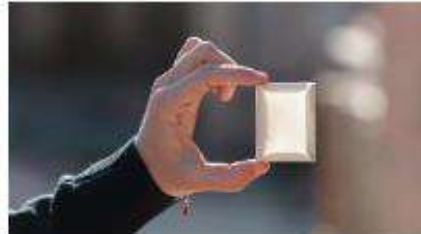
Una pieza en exposición, desde programa de residencias Ceramicres y exhibida en l'Alcova. J. ALBA VICENT

Por segundo año consecutivo, el programa de residencias artísticas Ceramicres que se celebra en l'Alcova exhibirá sus trabajos en la Feria de Arte Contemporáneo de Castellón