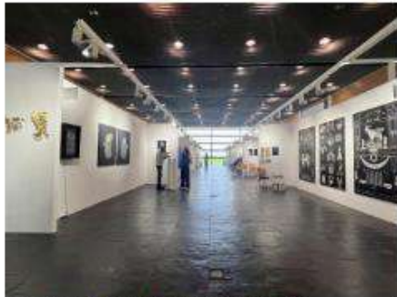
Vista interior de la feria MARTE. Castellón de la Plana en la Feria de Arte Contemporáneo de Castellón.

El Auditorio y Palacio de Congresos de la capital de la Plana será nuevamente el escenario para una exitosa muestra de galerías nacionales, cuya cantidad aumenta con cada edición. Cada veinte galerías han sido seleccionadas para participar en Marte Festival, donde se exhiben exposiciones individuales o diálogos entre sus artistas. Esta iniciativa busca promover el coleccionismo de obras de artistas emergentes o en medio de su carrera a precios accesibles. Se pretende atraer a aquellos que desean comenzar una colección de arte presentando artistas en un momento promotor de sus trayectorias.